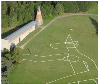
Yona Friedman_ La licorne de Vassiviere, 2009

Le Centre International d'Art et du Paysage de l'île de Vassivière (CIAPV), avec le soutien du Ministère de l'Europe et des Affaires Etrangères, invite un.e artiste Irannien.ne vivant en Iran pour une résidence de trois mois en résidence avec le territoire et autour de la notion de paysage.