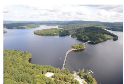
Lac de Vassivière