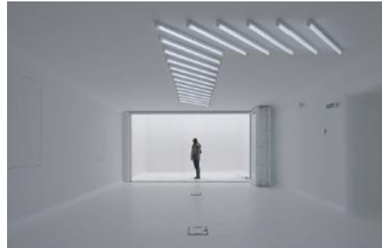
Notus Loci , réhabilitation du Château de Vassivière, par Berger&Berger et BuildingBuilding.

Honoraires de résidence : Le.la résident.e reçoit une allocation de résidence de 1000 € net par mois pris en charge par l'Ambassade de France en Iran. L'Ambassade de France prend également en charge le billet d'avion et le trajet du.de la résident.e jusqu'à Vassivière.