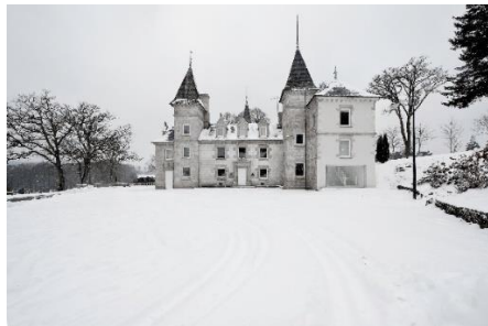
Notus Loci, réhabilitation du Château de Vassivière par Berger&Berger et BuildingBuilding.